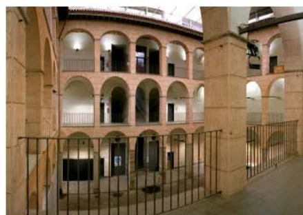
Museu de la Garrotxa Olot