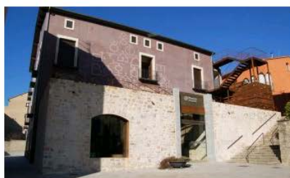
Museu Etnogràfic de Ripoll Ripoll