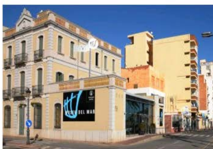
Museu del Mar de Lloret de Mar Lloret de Mar