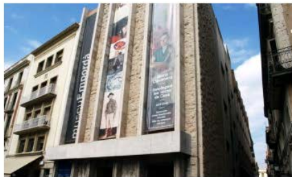
Museu de l'Empordà Figueras