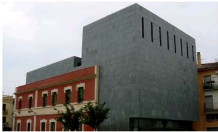
Museu Darder. Espai d'Interpretació de l'Estany Banyoles