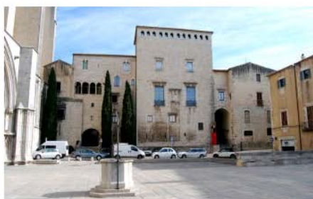
Museu d'Art de Girona Girona