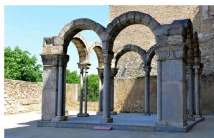
Museu d'Història de Girona Girona