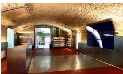
Museu de la Mediterrània Torroella de Montgrí