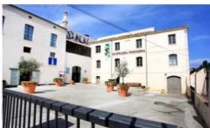
Ecomuseu-Farineria de Castelló d'Empúries Castelló d'Empúries