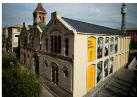
Museu del Suro de Palafrugell Palafrugell