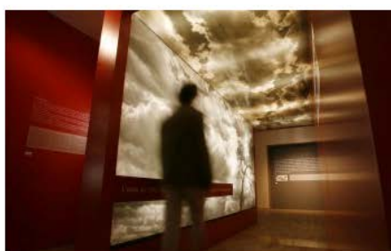
Museu d'Història dels Jueus Girona