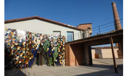
Terracotta. Museu de terrisa i ceràmica industrial La Bisbal de l'Empordà