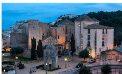
Museu d'Història Sant Feliu de Guíxols