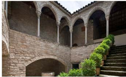
Museu Arqueològic Comarcal de Banyoles Banyoles