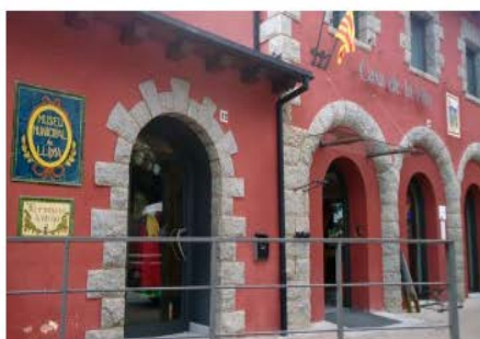
Museu Municipal de Llívia Llívia