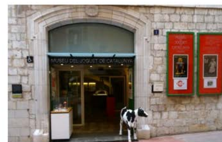
Museu del Joguet de Catalunya Figueres