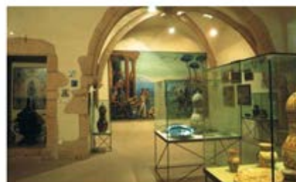
Museu Municipal Josep Aragay Breda