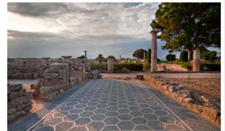
Museu d'Arqueologia de Catalunya-Empúries l'Escala