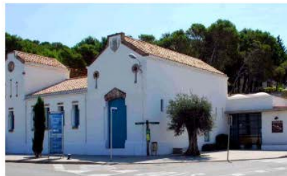
Museu de l'Anxova i de la Sal l'Escala