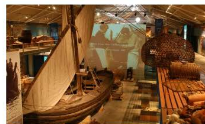
Museu de la Pesca de Palamós Palamós