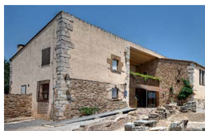
Museu d'Arqueologia de Catalunya-Ullastret Ullastret