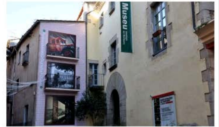
Museu Etnològic del Montseny. La Gabella Arbúcies