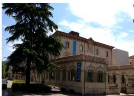
Museu dels Sants d'Olot Olot