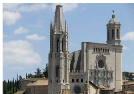
Tresor de la Catedral de Girona Girona